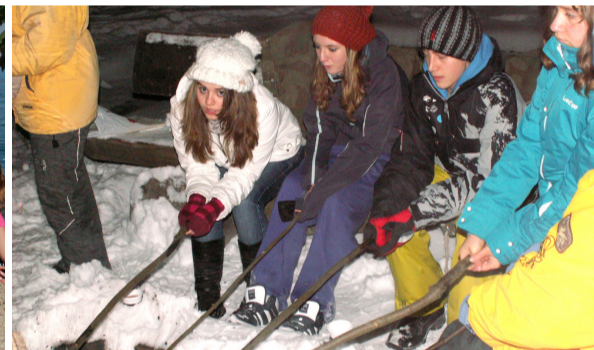
Der 5liber-Club bietet einmal im Monat Spiel und Spass für Kinder der 5. und 6. Klasse.

Im November 2005 startete das neue Angebot für Schülerinnen und Schüler der 5. und 6. Klasse. Das Konzept war einfach: Einmal im Monat soll für diese Altersgruppe ein Anlass stattfinden, der 5 Franken kostet. Alle Kinder (nicht nur Reformierte) sollen daran teilnehmen dürfen. Das Vorbereitungsteam bestand damals aus Sabrina Boesch, Dominic Keller und Therese Wihler.