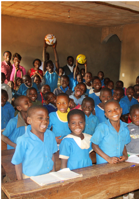
Das Projekt «Ashia Kamerun» hilft in erster Linie Kindern in Kamerun, unter anderem mit der Finanzierung von Schulbauten und Schulgeldern.